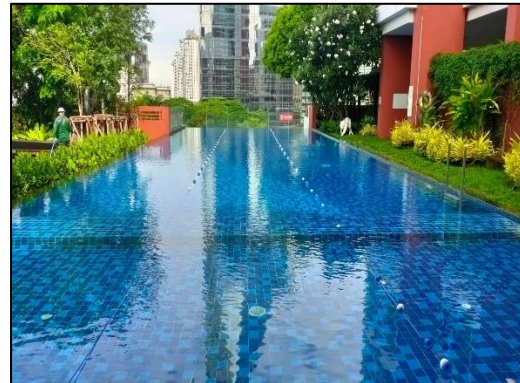
ภาพที่ 1.6-1 สถานภาพโครงการในปัจจุบัน